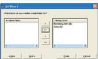
Schritt 5 Summenfelder festlegen