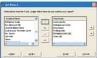
Schritt 2 Felder auswählen