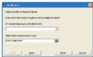
Schritt 1 Datenquelle auswählen